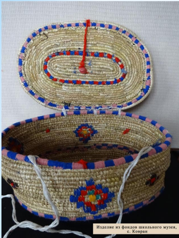
Изделие из фондов школьного музея, с. Ковран