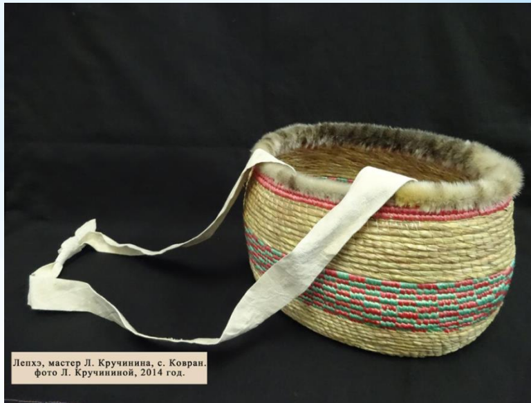
Лепхэ, мастер Л. Кручинина, с. Ковран. фото Л. Кручининой, 2014 год.