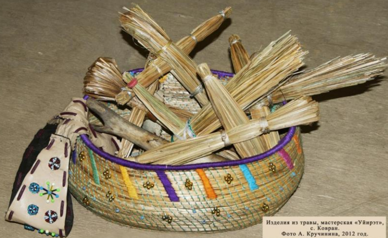
Изделия из травы, мастерская «Уйирэт», с. Ковран. 2012 год.