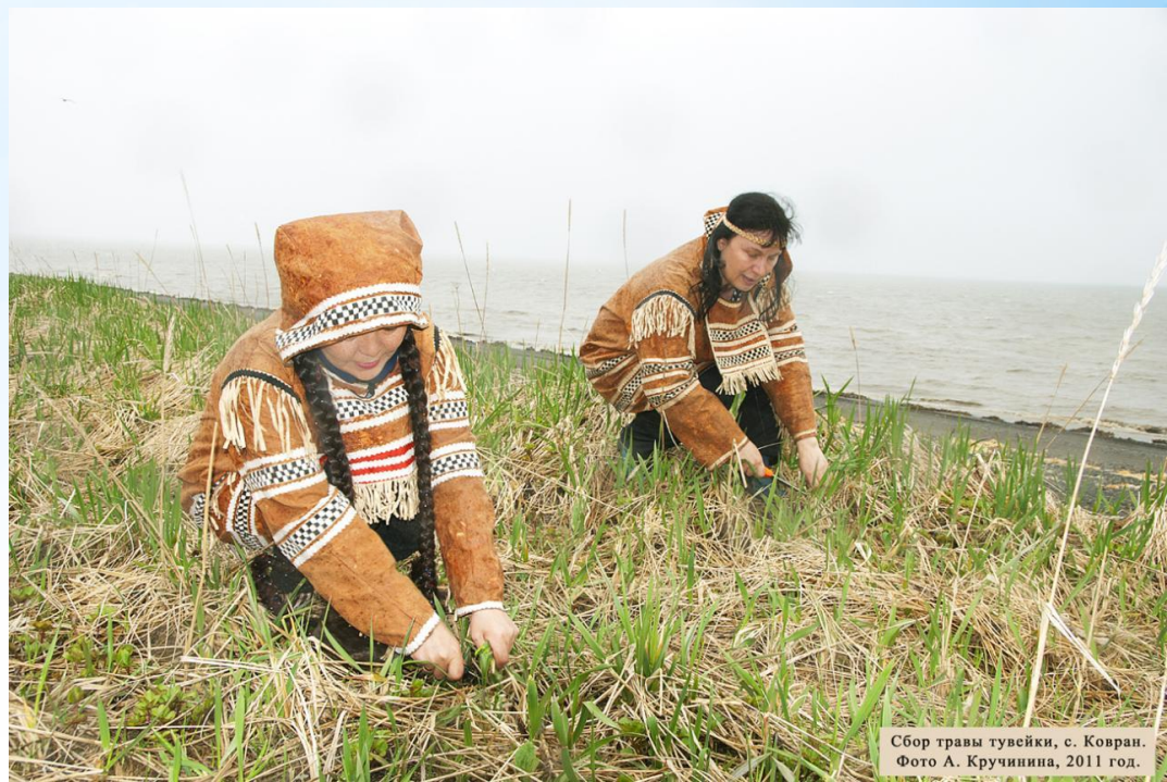
Сбор травы тувейки, с. Ковран. Фото А. Кручинина, 2011 год.