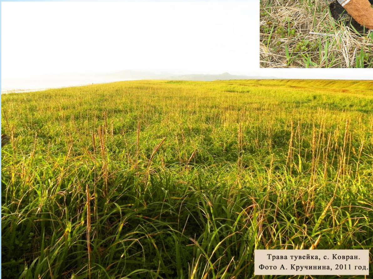
Трава тувейка, с. Ковран. Фото А. Кручинина, 2011 год.