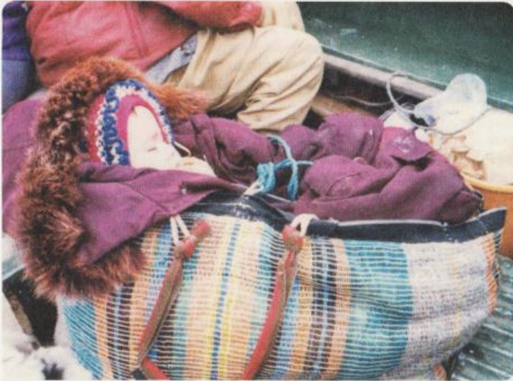
Маньв'. Корзина для переноски ребёнка.