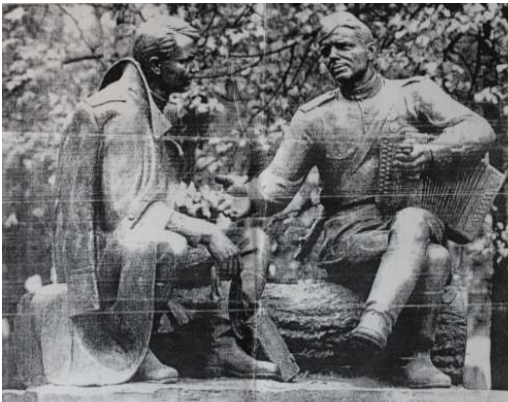
«Твардовский и Тёркин». Скульптор А. Г. Сергеев.